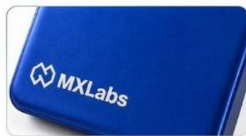
航空級鋁合金 + 親膚材質 輕盈耐用，防刮抗污