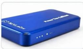
LED 電量指示燈 清晰顯示剩餘電量