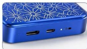
USB-C 雙向快充 輸入輸出皆支援快充