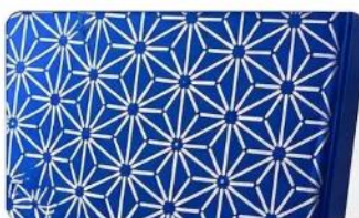
精緻組子紋理設計 展現東方工藝美學